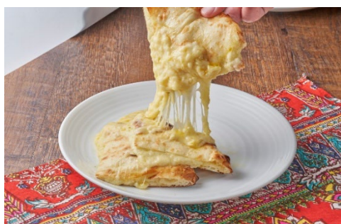
極みチーズナン 税込 1,200 円 ブレンドチーズを使用したカレーと相性抜群なナン

インド特有の土釜「タンドール窯」を使った本格的なグリル料理や、厳選したスパイスを駆使し作り上げたインド料理と共に、インドワインや豊富な種類の世界のお酒と共に食事体験をよりお楽しみいただけます。また、新鮮なハーブや野菜などシェフ厳選の食材を贅沢に使用し、インドカレーをはじめ、タンドール料理など幅広くご提供します。唯一無二のブレンドチーズを使用した「極みチーズナン」は、スパイシーなインドカレーとの相性が抜群です。インドの一流レストランで修業したシェフ独自の視点で作ったエスニック・アジアレストラン『Mother India』をお見逃しなく。