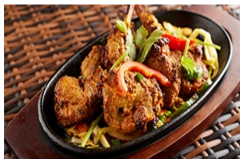
ラムチョップスペシャル Full 2,050 円 / Half 1,150 円 (税込) 骨付きラム肉を特製ソースに漬け込み、焼き上げたグリル