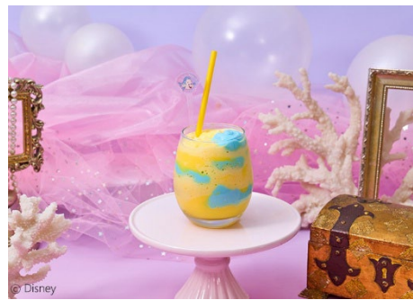
<フランダース>しましまヨーグルトスムージー 税込 1,190 円 フランダースの縞模様をイメージした二色のバイン風味のスムージー。※アクリルマドラーはお持ち帰り不可