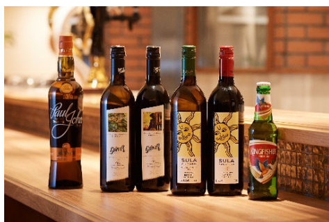
ドリンク イメージ