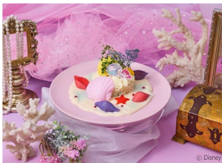
サンゴ礁のホワイトオムライス 税込 1,990 円 人間の世界を夢見るアリエルをイメージしたホワイトソースを使用した白いオムライス。

表参道ヒルズで、世代を超えて愛される「リトル・マーメイド」の世界観と、心と身体が喜ぶヘルシーなカフェタイムをお楽しみください。