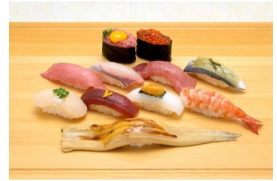
表参道にぎり 11 貫

個室×専属板前の贅沢体験！こだわりのお米「ささしぐれ」で味わう至高のにぎり『築地玉寿司 ささしぐれ』が4月25日に移転、リニューアルオープン。店舗面積はこれまでの倍となり、席数も拡大。ご要望の多かった6名様個室を新設し、様々なニーズに合わせた店舗へと生まれ変わります。個室は「専属板前付きカウンターサービス」を導入。お客様専属の板前が目の前で一貫ずつ丁寧に寿司を握り、最高のタイミングで味わえる贅沢なひとときをお楽しみいただけます。丁寧に仕込んだネタはもちろんのこと、「ささしぐれ」で握られた寿司は、口に含んだ瞬間、ふっくらとした米の甘みと香りが広がり、ネタ本来の旨みを引き立てます。また、オープニングキャンペーンとして、生本鮪の3貫盛り(大トロ、中トロ、赤身)を期間限定販売。品質・鮮度に自信を持つ江戸前のネタと、自然栽培米「ささしぐれ」のコラボレーションをお楽しみに。