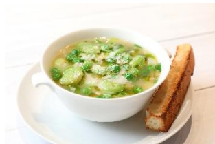
グランドハイアット 東京