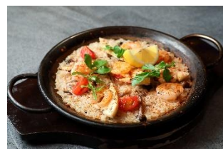
リゴレットバーアンドグリル