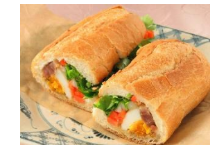
ニャーヴェトナム