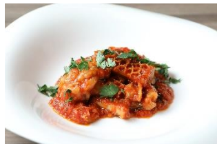
ヒルズ ダル・マツ