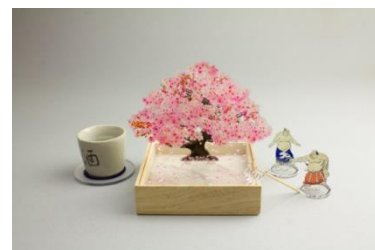
mini bonsai 5,500 円(税込) ※ぐい呑み、関取ピース別売り

樹脂加工のプロフェッショナル集団が独自の視点で日本製品の美を見つめ直し、次世代、海外に向けて、樹脂製品との豊かな暮らしを提案する toumei から、透明なアクリルに色鮮やかな花びらと、木箱に敷き詰めた白砂利とのコントラストが美しい作品、「bonsai 桜」が登場。その他にも「桜」をモチーフに使用した、コースター、箸置き、キーホルダーなども販売します。