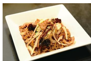
南翔饅頭店 (ナンショウマン トウテン)