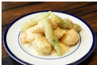
中国料理 ゴールデンタイガー