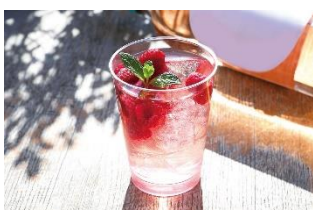
ワインショップ・エノテカ