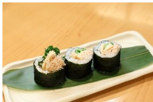
ぴんとこな / 鐵ちゃん

信濃屋 / 中国料理 ゴールデンタイガー / ニャーヴェトナム / 南翔饅頭店 / 梅蘭 / ぴんとこな / 鐵ちゃん ヒルズ ダル・マツ / 焼鳥 ここりこ庵 / リゴレットバーアンドグリル / ワインショップ・エノテカ