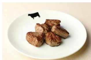
37 ステーキハウス & バー