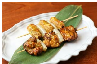
インド料理 ディヤ