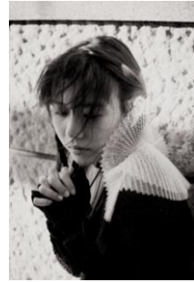
■ (スペシャルセッションゲスト) Mummy-D