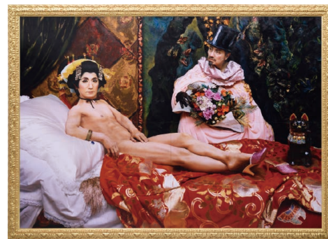
森村泰昌 《モデルヌ・オランピア2018》 2017-2018年 Cプリント、透明メディウム 210 × 300 cm 所蔵：森美術館(東京)