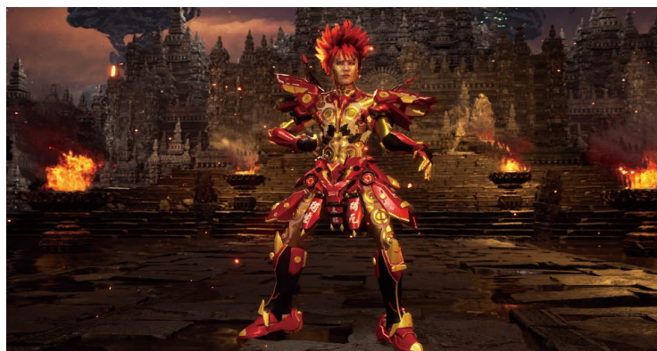
ルー・ヤン(陸揚) 《独生独死—自我》 2022年 ビデオ 36分 音楽：liiii