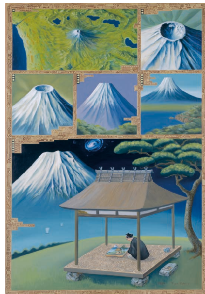
立石大河亜 《ミクロ富士》 1984 年 油彩、キャンバス 162 × 112 cm 所蔵：森美術館（東京）

フェリックス・ヴァロットン、ジャン＝フランシス・オービュルタン、 アンリ＝エドモン・クロス、ポール・シニャック、 アルフレッド・ステヴァンス、ポール・セリュジエ、 ラウル・デュフィ、モーリス・ドニ、ウジェーヌ・ブーダン、 ピエール・ボナール、アルベール・マルケ、ポール・ランソン、 ピエール＝オーギュスト・ルノワール、フェリックス・レガメ、 オーギュスト・ロダン、ほか