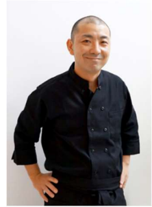
料理監修/伏木 暢頭