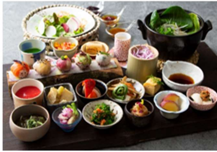
うつくしの御膳 ランチ(平日):4,800 円(税込) ランチ(土日祝):4,900 円(税込) ディナー(全日):4,950 円(税込)