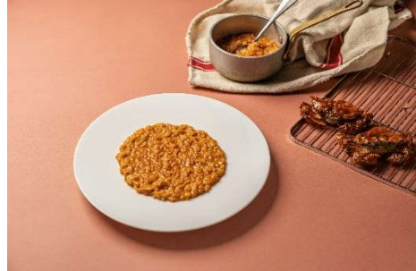
FINISH OFF - 記憶に残る \mu の一皿 \mu の濃厚ビスクリゾット CHEFS COURSE シェフ吉田 能のシェフズコース 5,500 円(税込)でのみ注文可 +700 円(2名様から)