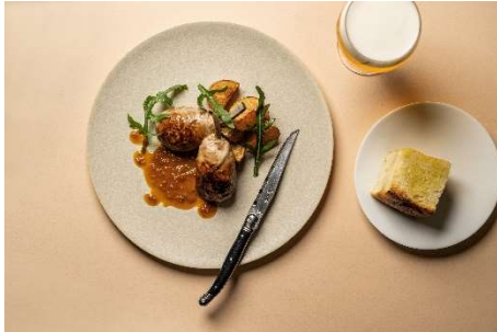
シェフが辿り着いた圧巻の仔羊ハンバーグ 2,200 円(税込)

吉田シェフ独自の視点で料理の本質を追求する料理動画のメニューが、洗練された一皿へ昇華する『SPICA』をお見逃しなく。