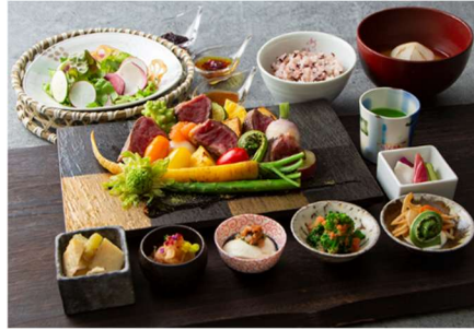
悠々と ランチ(平日):3,500 円(税込) ランチ(土日祝):3,600 円(税込) ※ディナーは販売なし