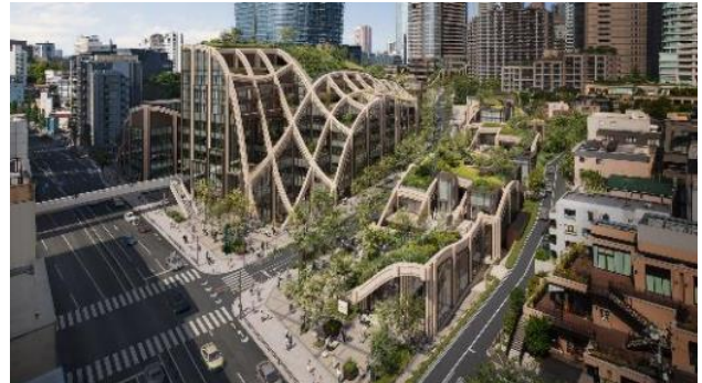
Azabudai Hills

施設名称 : 森ビル デジタルアート ミュージアム:エプソン チームラボボーダレス