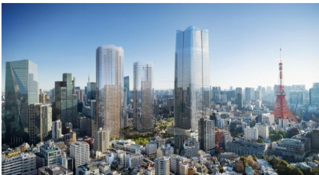
© DBOX for Mori Building Co., Ltd - Azabudai Hills

麻布台ヒルズは、当社が理想とする「都市の中の都市(コンパクトシティ)」であり、これまでのヒルズで培ったすべてを注ぎ込んだ「ヒルズの未来形」です。