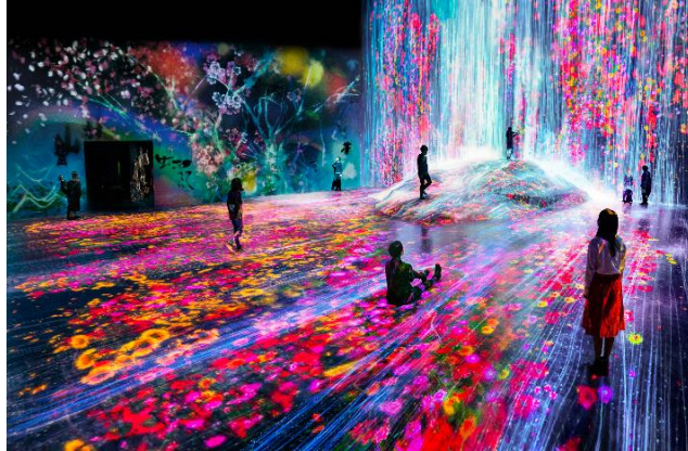
「森ビル デジタルアート ミュージアム:エプソン チームラボボーダレス」東京 © チームラボ

チームラボボーダレスは、アートコレクティブ・チームラボの境界のないアート群による「地図のないミュージアム」です。境界のないアート群は、部屋から出て他の部屋へと移動し、他の作品とコミュニケーションし、影響を受け、作品同士が混ざり合います。チームラボボーダレスは、そのような作品群によって、境界なく連続する1つの世界です。人々は、境界のないアートに身体ごと没入し、「境界のない1つの世界の中で、さまよい、探索し、発見する」のです。新しいチームラボボーダレスでは、境界のないアート群は、より進化し、より多くの場所へ移動し、複雑に関係し合い、永遠に変化し続ける境界のない一つの世界を創ります。