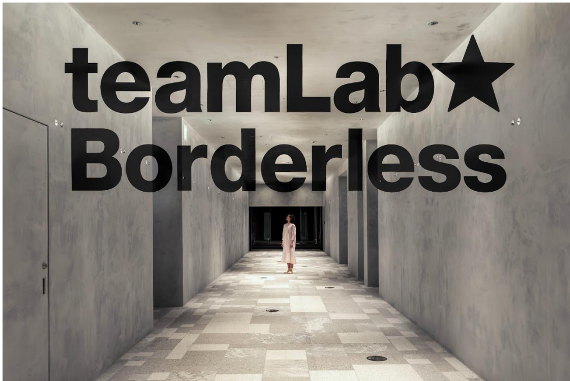
チームラボ《人間はカメラのように世界を見ていない》 エントランス「森ビル デジタルアートミュージアム:エプソン チームラボボーダレス」東京 麻布台ヒルズ © チームラボ

エントランス空間の指定の位置付近でカメラで見ると、「teamLab Borderless」の文字が空間に浮か上がり正体します。しかし、同じ場所で肉眼で直接見ても、文字は浮かがりません。人間はレンズのように世界を見ていないのです。