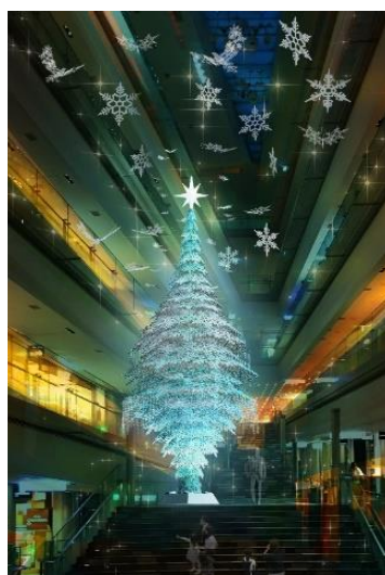
吹抜け大階段(イメージ)