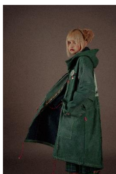
Fishtale coat 110,000円(税込)

「自然淘汰による進化」をコンセプトに掲げ、古着を使い様々に派生していくリメイクアイテムを生み出し続けていきます。人々に着られ手放され淘汰されていく中で何十年何百年先に残るような成功派生(進化個体)の誕生を目指すブランドです。今回のショップはラフォーレ原宿のみのオンリーショップ!個性あふれる商品が揃っています。