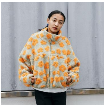
フラワーボアブルゾン 13,090 円(税込)