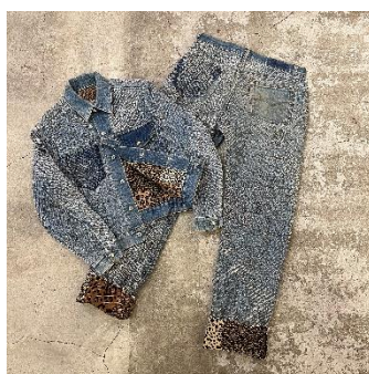
GEKIRIN jacket 88,000円(税込)