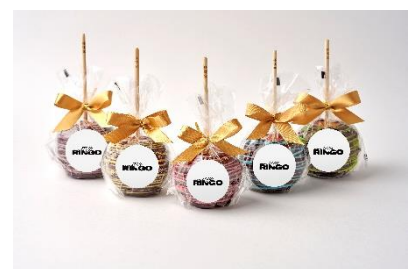
リンゴアメ専門店 林檎堂 / 2F リンゴアメ 5種 テイクアウトのみ 各 900円(税込)