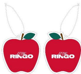
ITZY RINGO エアフレッシュナー 1,300 円(税込)