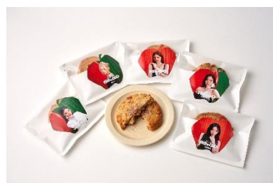
ovgo B.A.K.E.R Meiji St. / 2F MIDZY Apple Pie Cookie 450円(税込)