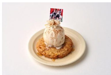
ovgo B.A.K.E.R Meiji St. / 2F MIDZY Cookie Sundae 1,100円(税込)