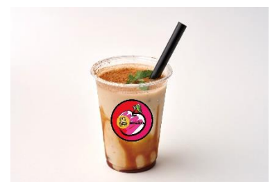
Guzman y Gomez / 2F ITZY のアップルスムーZY 660円(税込)