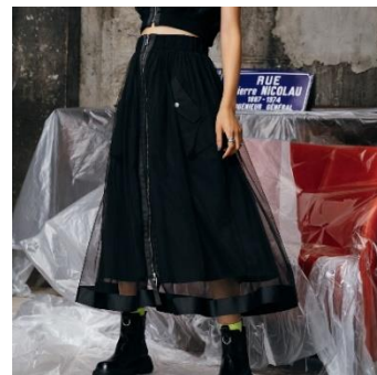
リバーシブル MA-1 スカート 16,390 円(税込)