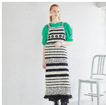
ボーダークロシェニットワンピース 9,790 円(税込)