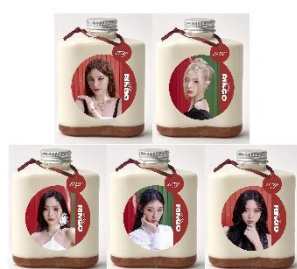
MILK MILK MILK! / 2F ボトルドリンク(アップルキャラメルミルク) イトイン 1,045円(税込) テイクアウト 1,026円(税込)