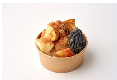
玄米と糀 moto / 2F 魅惑のりんごフレンチトースト イトイン 1,400円(税込) テイクアウト 1,375円(税込)