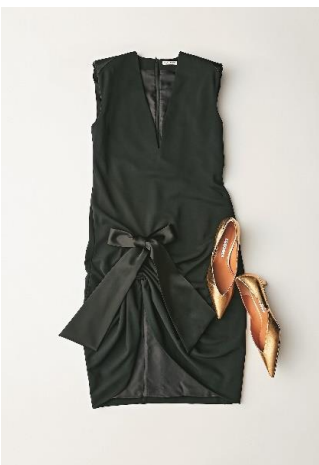
ワンピース (エストネーション) / シューズ (ピッピシク) エストネーション 110,000円 / 35,200円

時代を超えてセンシュアルなエレガンスを漂わせるサンローランの黒。新作のトートバッグは上質なレザーを使用し、軽さと使い心地の良さを実現。洗練されたパリのエッセンスをカップルで楽しんでみては。