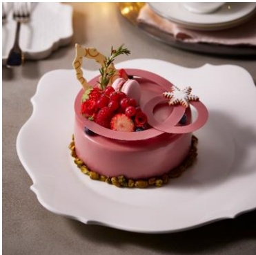
JG クリスマスケーキ ジャン・ジョルジュ トウキョウ 5,500 円

※12 月 21 日(木)~12 月 25 日(月)は当日販売もあり。ただし予約が埋まり次第完売となる場合があるため、事前予約がおすすめです。