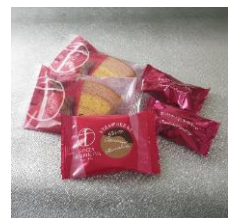
クリスマスギフトセット ニュースタイル銀座千疋屋 1,080円