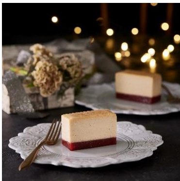
ホワイトストロベリーチーズテリーヌ ハグフラワー トウキョウ 1個入り 950円/6個入り 4,800円

北海道産の乳製品を使用した個包装のグルテンフリー・チーズテリーヌが人気の「ハグフラワー トウキョウ」。「ホワイトストロベリーチーズテリーヌ」は、チーズのほのかな酸味とストロベリージュレの爽やかな甘味がよく合う限定品です。チーズテリーヌはすべて冷凍の状態で、1個から箱入りでご用意。半解凍にすればシャリっとした口当たりをお楽しみいただけます。