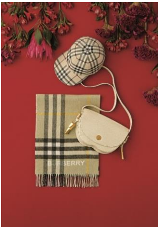
バッグ「チェス サッチェル」 バーバリー 385,000円

レディースウォッチは、これからの季節にふさわしい華やかなレッドをピックアップ。赤い花を描いたストラップはロマンティック派のあなたに。天然石の赤い文字盤をダイヤモンドのパヴェセッティングが飾る時計は、パーティーシーンでも会話が弾むカンパセーションピース。