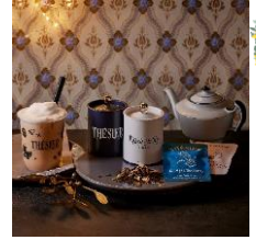
六本木アールグレイロイヤル ※写真左 紅茶専門店 テシエ TAKE OUT 980円