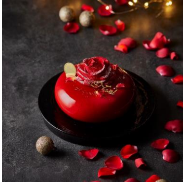
ノエル ローズ マリーアントワネット ラ プティック ドゥ ジョエル・ロブション 8,800 円

クリスマスにかかせないのが、味、見た目ともに心を満たしてくれる美しいクリスマスケーキ。六本木ヒルズでは、美食家を魅了し続ける「ラ プティック ドゥ ジョエル・ロブション」、「ジャン・ジョルジュ トウキョウ」といったフレンチの名店が手掛けるケーキや、「イルブリオ」、「ラ・メゾン・デュ・ショコラ」の上品な見た目や大人の味わいが魅力のケーキなど、全 10 店舗 15 品のクリスマスケーキを揃えました。六本木ヒルズならではの特別なケーキとともに、年に 1 度の素敵なクリスマスをお楽しみください。