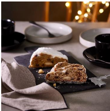
シュトーレン ブリコラージュ ブレッド アンド カンパニー 3,500円

販売期間 11月7日(火)～12月25日(月) 提供時間 11:00～21:00 (金土祝前日は ~21:30)