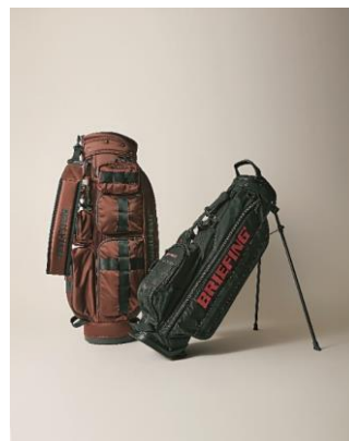
ゴルフバッグ ブリーフィング 57,200円 (右・大人用) 86,900円 (左・子供用)

現在形のラグジュアリーに出合えるモードの殿堂エストネーション。ヘムをリボンで留めた黒のワンピースはパンツと合わせても◎。ゴールドのパンプスはVのカットが足をきれいに見せてくれます。