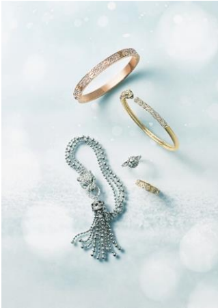
ブレスレット「パンテールドゥ カルティエ」 カルティエ 12,276,000円 (写真左下)

グルメやスイーツだけでなく、六本木ヒルズではクリスマスを華やかに彩る厳選ギフトもご用意。ウォッチ&ジュエリーをはじめとしたラグジュアリーブランドのアイテムはもちろん、セレクトショップが厳選するファッションアイテムからライフスタイルグッズ、トレンドのゴルフアイテムまで、六本木ヒルズらしいハイクオリティかつユニークなアイテムを取り揃えています。