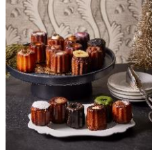
18BOX カヌレ ド キャンティ 4,000円