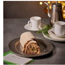
ロブションのシュトーレン ラ プティック ドゥ ジョエル・ロブション 小2,800円 (箱代別途350円) 大4,700円 (箱代込み)