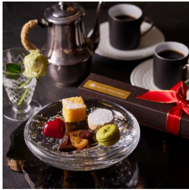
クリスマスギフト ヒルズ ダル・マット 1,980円

イルミネーションやショッピングとともに、クリスマス気分をさらに盛り上げる限定スイーツやドリンクもお楽しみいただけます。11月6日(月)から始まる66プラザのイルミネーション「Luminous Bouquet」を彷彿とさせる、色とりどりの鮮やかなスイーツや、シュトーレン、チーズテリーヌなどの幅広いバリエーションのスイーツが、全20店舗25品の豊富なクリスマスメニューとして六本木ヒルズに登場します。六本木ヒルズでしか味わえないクリスマスモードをお楽しみください。