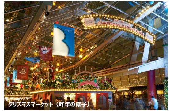
クリスマスマーケット（昨年の様子）

国内でも有数の老舗クリスマスマーケットとして知られる六本木ヒルズのクリスマスマーケットは今年で開催17年目を迎えます。会場は世界最大と言われるドイツ・シュツットガルトのクリスマスマーケットを再現。一年中伝統的なドイツのクリスマスアイテムを取り扱うことで有名な「ケーテ・ウォルフアルト」をはじめ、ドイツオリジナルのクリスマス雑貨が2,000種類以上並ぶショップやグリュウワイン、ソーセージといった本格的なドイツグルメも楽しめます。まるでドイツを訪れているかのような本場さながらの雰囲気をお楽しみください。