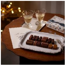
ノエルジヴレS1 ラ・メゾン・デュ・ショコラ 6,480円