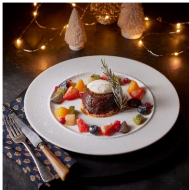
グラホのタルト・タタン グランドフードホール EAT IN 960円