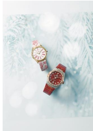
ミニ トレゾア/コンステレーション オメガ 1,353,000円 / 2,288,000円 (上から)

カルティエを象徴する「LOVE」、「パンテールドゥ カルティエ」の2つのコレクションと、女性たちの永遠の憧れ「カルティエ ディスティネ」のダイヤモンド。ブレスレットとリングを重ねつけた華やかな手元は、特別なシーンで視線が集中すること請け合い。