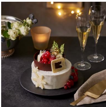
莓のデコレーションケーキ イルブリオ 5,500 円 (3~4 人用) / 7,200 円 (5~6 人用) EAT IN (1/6 カット) 900 円