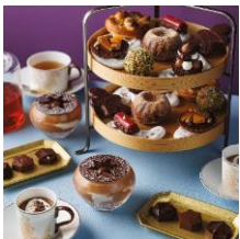
LE GOÛTER DE NOËL ル・ショコラ・アラン・デュカス 六本木 EAT IN 6,500円 (土日祝7,000円)