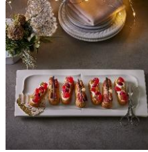
プチエクレール10個入 クレーム デ ラ クレーム 2,808円