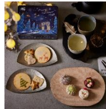
赤坂柿山「メリークリスマス」 巖邑堂「クリスマス上生菓子」(4種) 菓子の記録帖 赤坂柿山1,620円 ※売り切れ次第終了 巖邑堂各432円 ※1日5個程度(取扱無しの日もあり)