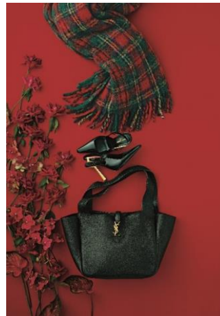
バッグ「ベア」 サンローラン 456,500円

12月1日にリニューアルオープンするバーバリーより、アイコンのハウスチェックが多彩なバリエーションで登場。着こなしにオーセンティックなモダンブリティッシュのムードをプラスします。アルファベットのBをフォルムに落とし込んだ新作バッグ「チェス」は、今季の注目です。