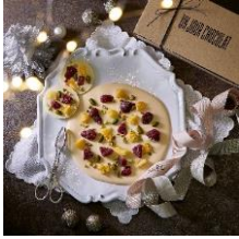
ラウンドショコラ クリスマス/ベビ ーラウンドショコラ クリスマス アンジュールショコラ 3,400円/390円