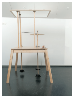
《終わりなき研究》2005年 展示風景：ルンド・コンストハーレ(スウェーデン) 2005年

※オラファー・エリアソン・スタジオが本展のためにデザインした展覧会ロゴスタンプを押印し、専用ケースに入れてお渡します。 ※数量限定のため、なくなり次第終了となります。