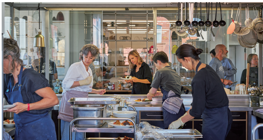
スタジオ・オラファー・エリアソン キッチンの様子 (2023年)