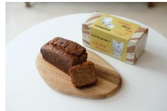
トラのもん バナナブレッド

AM STRAM GRAM で人気のピーナッツバタークッキーが虎ノ門ヒルズ限定フレーバーで登場。トラのもんをデザインした可愛らしい缶のデザインは全2種類ご用意しています。