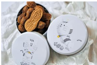
トラのもん ピーナッツバター クッキー（13粒入り）