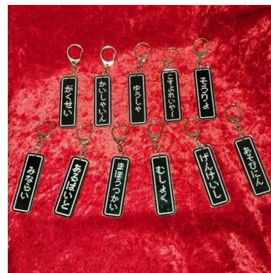
職業キーリング 1500円(税込)