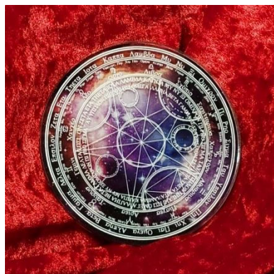
魔法陣コースター 1900円(税込)

ファンタジー武器屋 TAKUMIARMORY。「2次元を3次元に」をコンセプトにアクリルをはじめとするプラスチックでファンタジーあふれる造形物を制作しており、大手アニメ制作会社から公式で剣を依頼されるほど精巧な作り。実際に剣を持って体験できます。