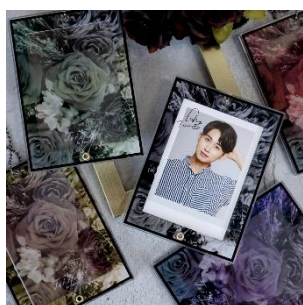
フォトカードアクリルフレーム モトーンフラワー 1,100円(税込)

今回のPOP UP SHOPでは新商品 7アイテムを発売し、税込 5,000円以上お買上げのお客様へ先着でノベルティをプレゼントします。