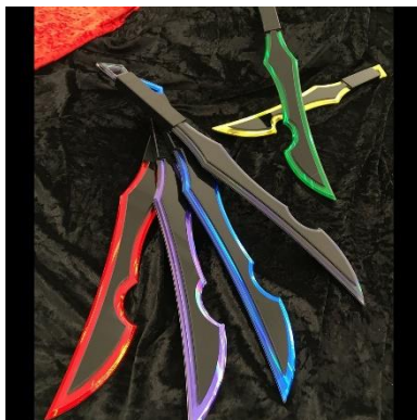
ロミングカトラス 16900円(税込)