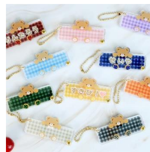
おなまえカスタムネームタグアクリルフレーム だっこベア 990円(税込)