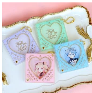
クラシカルハートミニアクリルフレーム 880円(税込)