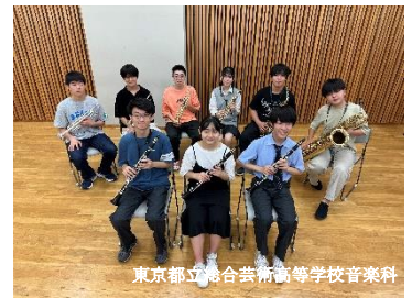
東京都立総合芸術高等学校音楽科