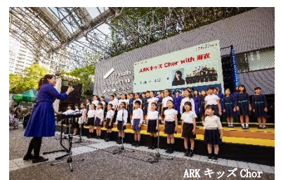
ARK キッズ Chor