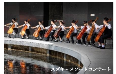
スズキ・メソードコンサート