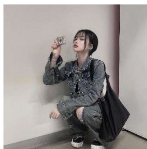
trend denim setup 8,200円(税込)