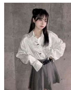
ダブルベルトプリーツスカート 4,700円(税込)