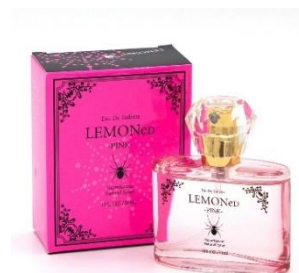
香水/LEMONeD PINK 6,600円(税込)