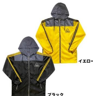
ラインパーカー(ブラック・イエロー) 18,700円(税込)