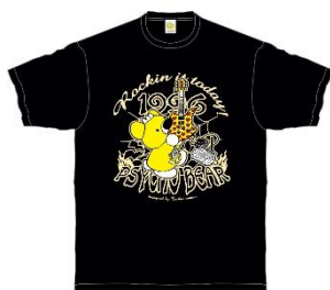
Tシャツ/Rockin it today! 4,400円(税込)

“コワイ(コワくてカワイイ)”をコンセプトとしたウェアや雑貨が所狭しと並ぶ店内は、まさに hide のイタズラな原色のイメージが詰まったオモチャ箱。年に数回のキャンペーン期間中はウィークリーNew アイテムを発売するほか、スタンプカードキャンペーンではノベルティをプレゼントします。