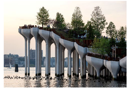
ヘザウィック・スタジオ

東京シティビューでは3月17日(金)より「ヘザウィック・スタジオ展：共感する建築」を開催します。本展は、ヘザウィック・スタジオの主要プロジェクト28件を天空の大空間で紹介する日本で最初の展覧会です。試行錯誤を重ね、新しいアイデアを実現する彼らの仕事を「ひとつになる」、「みんなとつながる」、「彫刻的空間を体感する」、「都市空間で自然を感じる」、「記憶を未来へつなげる」、「遊ぶ、使う」の6つの視点で構成し、人間の心を動かす優しさ、美しさ、知的な興奮、そして共感をもたらす建築とは何かを探ります。展望台で“天空のお花見”を楽しみながら、ヘザウィック・スタジオの世界観をご堪能ください。