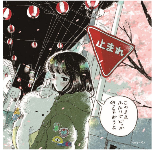
《咲いてしまった気持ちは止められない》