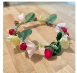
お花のかんむり(イメージ)