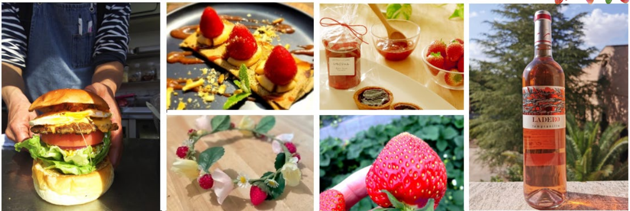
左から時計回りに「ラッキーバーガー」「glycine」「KateeSweets」「エスタリコ・ジャパン」「とちあいかイチゴ」「シャーロットヒース フラワーカンパニー」