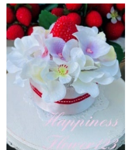
ストロベリーケーキ(イメージ)

時 間： 随時受付(2点で約45分) 定 員： 同時に4名まで 料 金： 3,500円(税込)