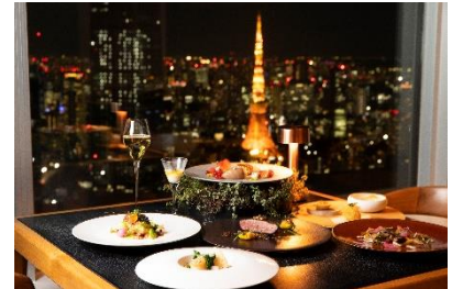
賞品ディナー イメージ