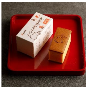
烏鷄庵かすていら 干支 烏鷄庵 1,555 円