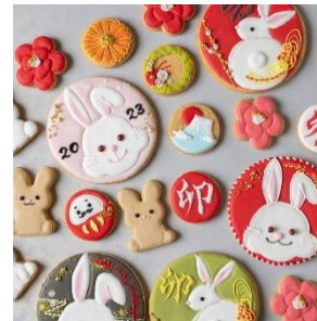
干支クッキー(うさぎ) フィオレンティーナ パストリーブティック 1,500 円(1 枚) / 2,000 円(小サイズ 4 枚セット)