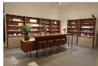
エストネーション