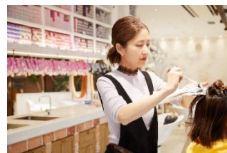
カキモト アームズ