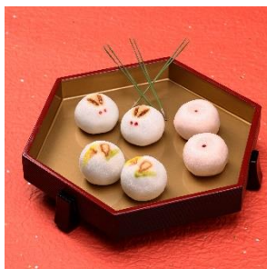
風流堂「干支朝汐」 菓子記録帖 9 個入り 1,404 円 ※入荷分が売り切れ次第終了

2023 年は卯年。六本木ヒルズでは、ご来街くださる皆さまへの益々の飛躍を願って、縁起の良い「卯」モチーフのスイーツを取り揃えています。見た目も可愛い「卯」スイーツは、お年賀にも喜ばれること間違いなしです。六本木ヒルズの「卯年」アイテムで縁起を担いでみませんか。