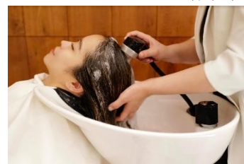
カキモト アームズ