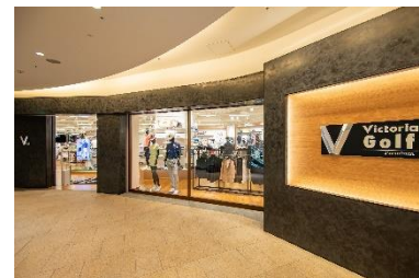
ヴィクトリアゴルフ