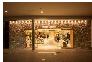
ユナイテッドアローズ 六本木