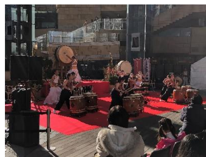
過去開催時の様子