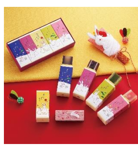
干支 ささらがた 和菓子 結 1,404 円