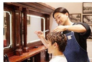
メンズグルーミングサロン & ストア バイ カキモトアームズ