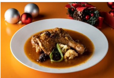
ハセガワ冬の名物！ブラチキ！ ～骨付き鶏もも肉のブランデー煮～ cafe-vino-tapas LA TAVERNA ハセガワ 2,600 円

開催日程： 11月18日(金)～12月25日(土) ※提供期間は店舗によって異なります。詳細情報は WEB をご確認ください。 参加店舗： Brianza 6・1、Bubby's New York ARK Hills、cafe-vino-tapas LA TAVERNA ハセガワ、HALE 海's、THE CITY BAKERY BRASSERIE RUBIN、TOKYO MIX CURRY、RUBY JACK'S Steakhouse & Bar、アークヒルズカフェ、ウルフギャング・パルク ピッツァバー、タイ料理 チャンロイ kaaw 詳細 URL: https://www.arkhills.com/events/2022/11/0040.html