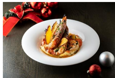
赤海老のロースト マッシュポレンタ THE CITY BAKERY BRASSERIE RUBIN 3,200 円

ボリューム満点！お肉はとて柔らかく、優しい味わいでコクもあり、異国感がありながらもどこか親しみのある一品です。 提供期間：12月1日～12月24日 ※1日限定5食