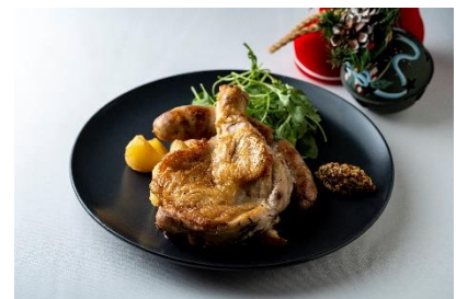
骨付き鶏もも肉のローストとサルシッチャプレート Brianza 6・1 3,000 円

帆立、マッシュポテトを混ぜ合わせたクリーミーなポレンタに、赤海老のロースト、さつまいものチップをあわせました。ピリ辛なスワッグと一緒に。 提供期間：12月1日～12月31日 ※アークヒルズ店限定 ※ディナーのみ提供