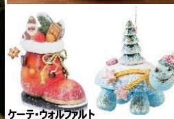
ケーテ・ウォルフアルト