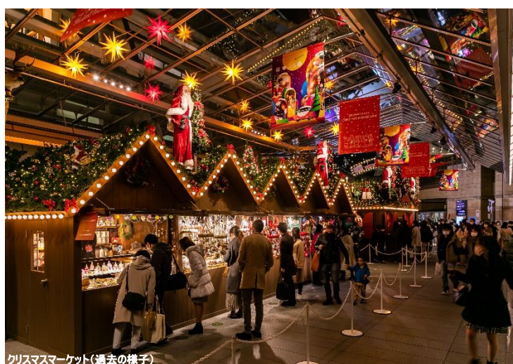
クリスマスマーケット(過去の様子)

2016年以来6年ぶりにクリスマスイブとクリスマスが土日に重なる今年、ホームパーティーを飾り付けるためのショッピングや、クリスマスのデートに、ぜひ足を運んでみてください。