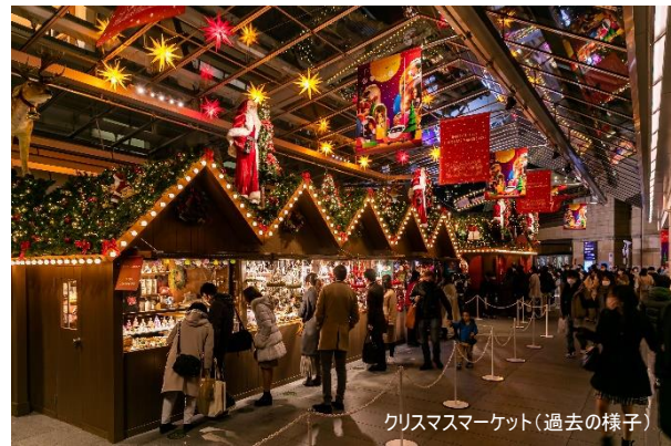
クリスマスマーケット(過去の様子)