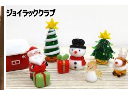
ジョイラッククラブ