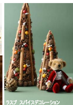
ラスプ スパイスデコレーション