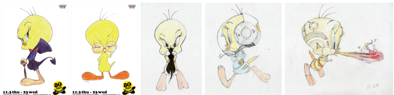
<イラスト原画一例>

※オリジナルトゥイーティーをパラパラ漫画風にした限定ノベルティもご用意 (お買上条件がございます)。