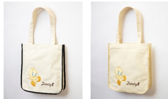
パイピングスクエアトートバッグ 各 5,500円