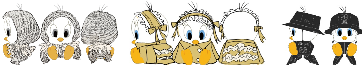
<スタチューデザインイメージ>

10名のクリエイターによって独創的なデザインに変身したトゥイーティのスタチューをお楽しみいただけます。