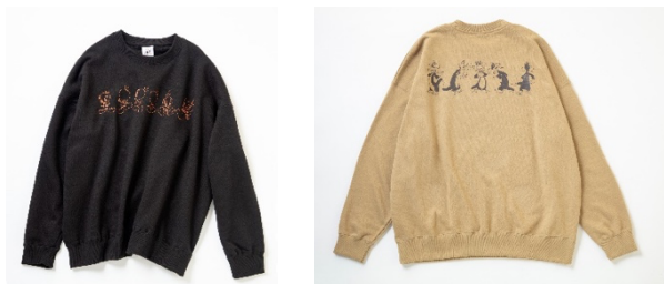
プルオーバー 各 7,590円