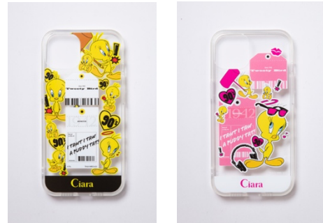
スマホケース 各 3,300円