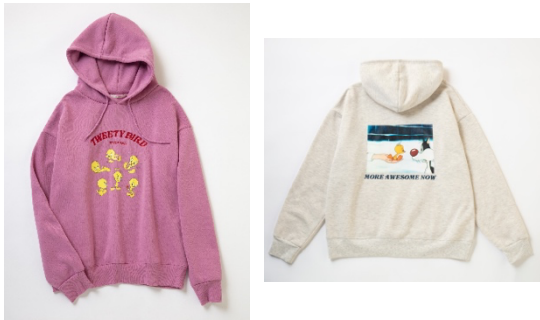
ビッグパーカー 各 5,940円