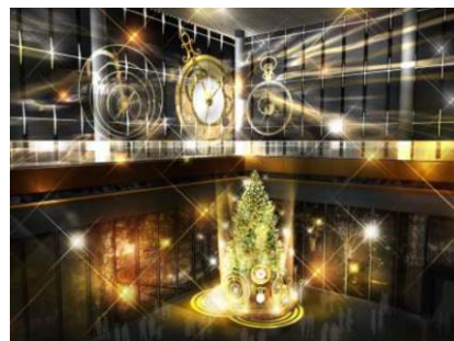
<丸ビル 1 階マルキューブ クリスマスツリーイメージパース>

TEL：03-4323-0100 E-mail： marunouchi@ozma.co.jp