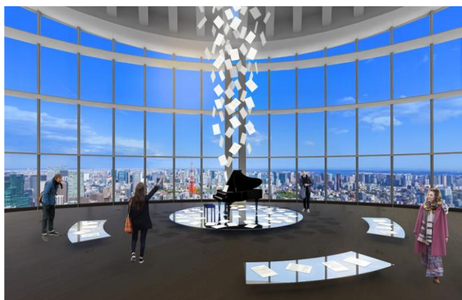
<エントランスイメージ>

会期：2022年12月8日(木)～2023年2月26日(日) 会場：東京シティビュー