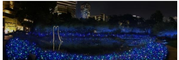
「毛利庭園イルミネーション」(イメージ)

開催期間： 11月18日(金)～12月25日(日) 時間： 17:00～23:00 場所： 毛利庭園 ライティングデザイン： 内原智史デザイン事務所 協賛： アバター:ウエイ・オブ・ウォーター