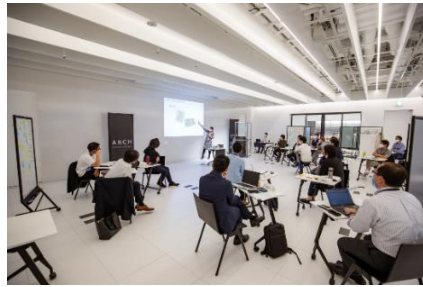
セミナーやイベントを開催する 「マグネットルーム」