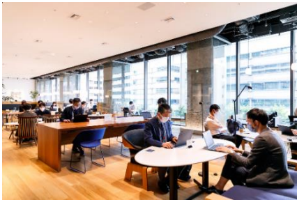
異業種交流の場 「コワークスペース」