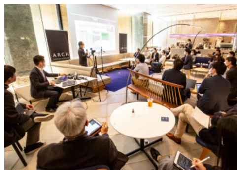
協創相手を募る新規事業のアイデアピッチ