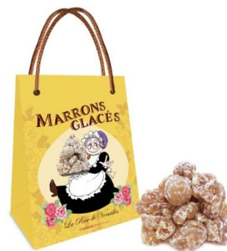
「マロンのマロングラッセ」（1,080 円）