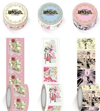
幅広マスキングテープ（全 3 種、各 770 円）

なお、会期前・会期中を問わず、購入個数制限を変更する場合があります。あらかじめご了承ください。