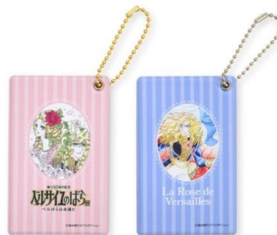
バスケース（全 2 種、各 1,650 円）