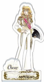
アクリルスタンド（全 8 種、各 1,100 円）