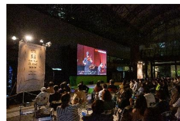
※過去開催の様子 (スペシャル・ライブ・ビューイング)