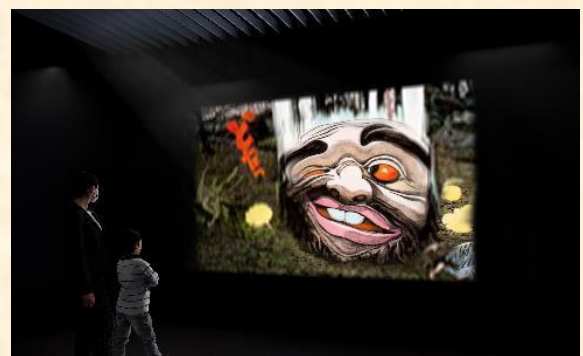
▲第3章：水木しげるの妖怪工房