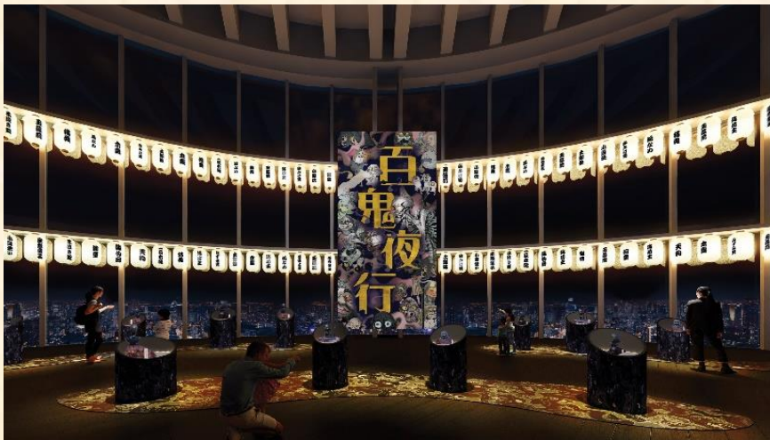
&lt;エントランスイメージ（夜）&gt;

本展は水木しげる生誕100周年を記念して、東京シティビューを舞台に水木しげるの妖怪世界を壮大な景色とともに存分にお楽しみいただける展覧会です。本展では、水木しげるの描いた日本の妖怪たちがどのように生まれてきたかを紐解きます。江戸時代の絵師・鳥山石燕の「画図百鬼夜行」、昭和初期の民俗学者・柳田國男の「妖怪談義」など、水木自身が所蔵する妖怪関係資料を初公開。そして百鬼夜行の名にふさわしく、水木しげるの妖怪画を100点以上にわたって一挙公開します。妖怪研究に没頭し、現代の日本人に「妖怪」という文化を根付かせた水木しげるはどのように妖怪と向き合い、描いてきたのか。本展を通して妖怪を身近に感じて下さい。