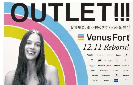
アウトレットフロアオープン・広告 (2009年)