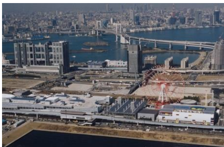
開業当初のパレットタウンの全景(1999年)