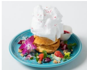
そらのfluffy(フラッフィー)パンケーキ! 湘南パンケーキ [2F]

苺風味のショートケーキに苺のクリーム、苺ジャムをサンドしたショートケーキ。周りには苺、クランベリー、食用花で彩り、Venus GRANDの赤をイメージした一品です。