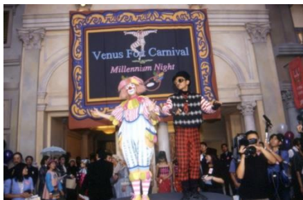
オープニングイベント (1999年)