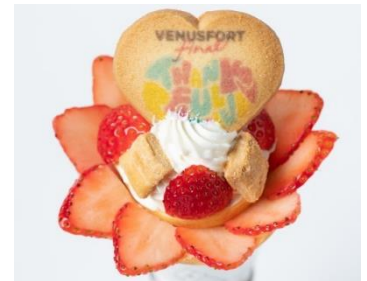
いちごたっぷりTHANKFULクレープ MOMI & TOY'S [2F]

ヴィーナスフォートの空に浮かぶイメージ。焼きたてのパンケーキにふわふわのコットンキャンディーをトッピング。ソースで雲を溶かすと中から何かが...!!