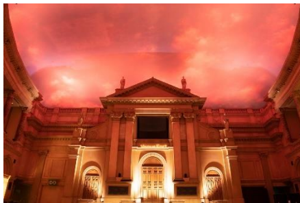
スカイプログラムによる演出(夕景)