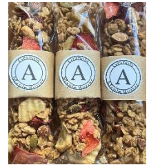
いちごバナナのメイプルバター・グラノーラ (Anboerie)