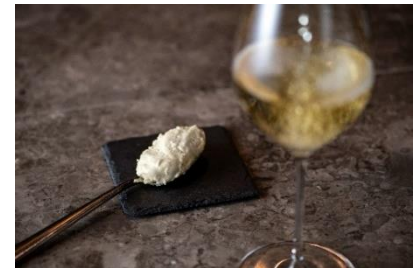
【ワインショップ・エノテカ&バー】本館 3F