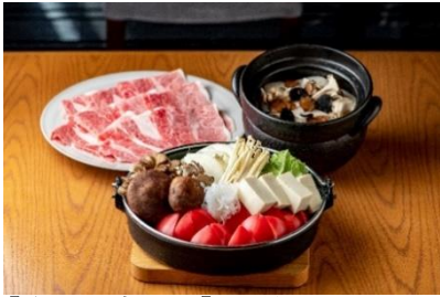
【やさい家めい】本館 3F 鳥取和牛ときのこ、トマトのすき焼きとトリュフ土鍋ご飯 (8,789 円/税込)

鳥取和牛をトマトやきのこ、厳選野菜とあわせていただくすき焼きは年末年始にふさわしい一品で、からだの中からヘルシーに温まります。自慢のお野菜を楽しめる前菜5種もセットになったコースのべには、トリュフ香る土鍋ご飯をご提供。