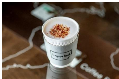
【インパーフェクト】同潤館 1F ホワイトストロベリーチョコレート (750 円/税込)

ルイ・ロデレールが造る上品な味わいのシャンパーニュに、モンドールチーズを合わせた季節を感じるペアリングセット。寒い季節に造られるこのチーズは、とろりと滑らかなミルクのコクに針葉樹の香りが重なり、穏やかな味わいを楽しめます。※閉店 30 分前 L. 0. ※1 日限定 10 食