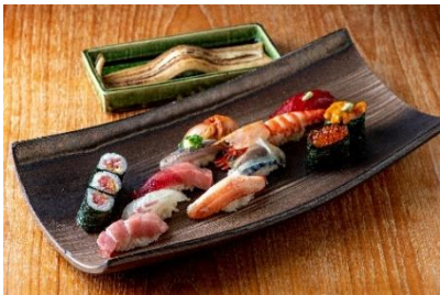
【築地玉寿司 ささしぐれ】本館 3F 贅沢ご褒美にぎり (7,000 円/税込)

甘めのポートワインソースでソテーしたフォアグラが贅沢に2枚も入った極上バーガー。フレッシュなりんごのスライスとルッコラで爽やかな食感と香りを加え、濃厚でありながらさっぱりとした食後感のバーガーになっています。※1 日限定 5 食