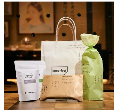
インパーフェクト (同潤館 1F) 1,000円 (1,340円相当) 各日限定10個 2,000円 (2,860円相当) 各日限定10個 ※2,000円の福袋の中身イメージです。

※福袋には、ワイン1本が入っています。 ※5,000円の福袋の中身イメージです。