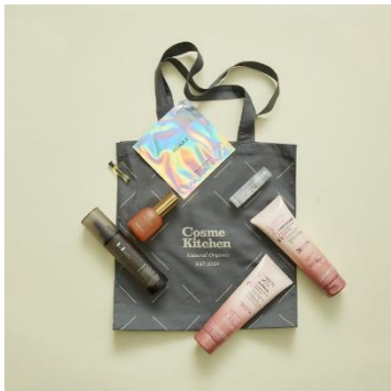
コスメキッチン ビューティー (本館 B2F) 7,700円 (15,570円相当) 限定20個