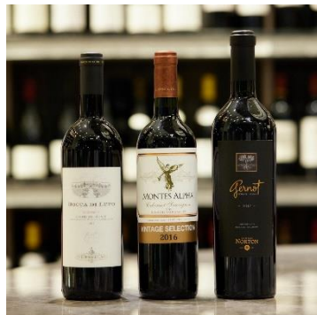
ワインショップ・エノテカ&バー (本館 3F) 5,000円 (5,500～46,200円相当) 10,000円 (11,000～99,000円相当) 各限定50個

※福袋には、ワイン1本が入っています。 ※5,000円の福袋の中身イメージです。