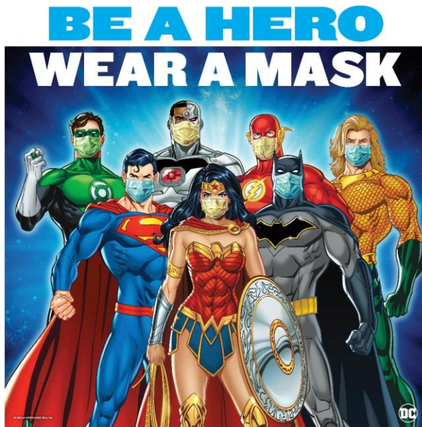
▲DC展会場内に掲示のサイン：ヒーローたちもマスクを着用

本リリースでは、世界に先駆けて本展覧会でしか見られない展示など、見逃し厳禁な情報を実際の展示写真とともに公開します。さらに、会場に隣接したレストラン「THE SUN & THE MOON」で提供しているDCコラボレーションメニューが、8月13日（金）より映画『ザ・スーサイド・スクワッド“極”悪党、集結』の公開に合わせて新メニューに変わります。世界中で大ブレイクしたハーレイ・クインが登場する本作にも大注目！この夏より一層盛り上がりを見せるDCの世界を、ぜひお楽しみください。