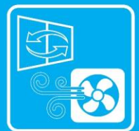
▲DC展オリジナル感染症対策サイン。よく見るとあの人気キャラが！

DC展では、新型コロナウイルス感染症対策を徹底して営業しています。ヒーローたちも、マスクを着用した姿でお出迎えしご来場の皆さまへのマスク着用を呼びかけています。