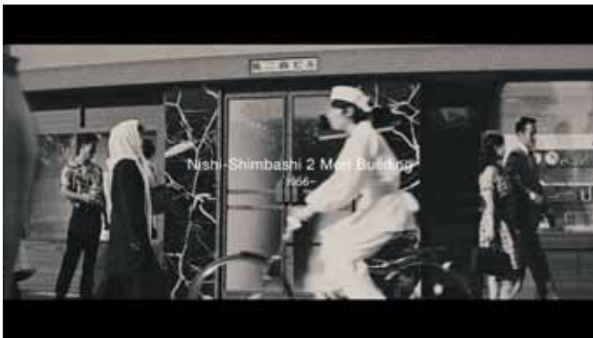
1956 西新橋2 森ビル