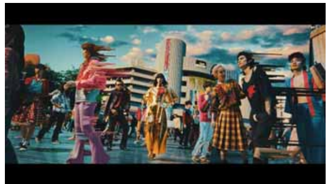
1978 ラフォーレ原宿(山口小夜子 -当時)