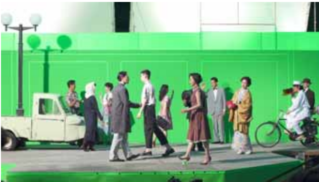
メイキング：西新橋 2 森ビル前