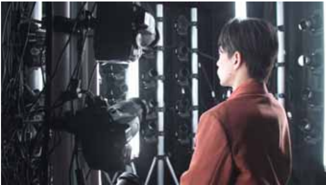
メイキング：人物の 3D キャプチャ