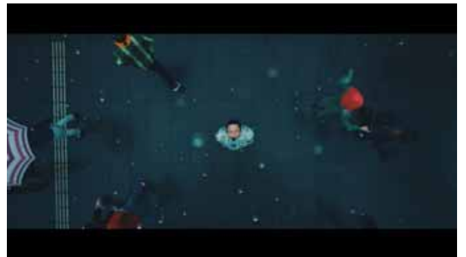
2003 六本木ヒルズ(村上隆 - 41 歳当時)