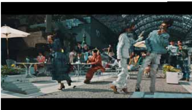
1986 アークヒルズ(坂本龍一 - 34 歳当時)