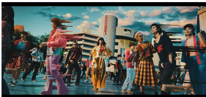
森ビルブランドムービー「DESIGNING TOKYO」