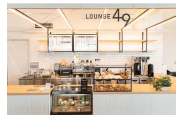
6月にリニューアルオープンした「LOUNGE 49」