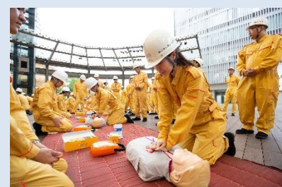
発災時の現場対応力向上の為継続的な防災人員育成に取り組む