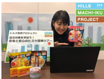
六本木ヒルズの備蓄品を例に、「備え」の大切さを学ぶ

森ビルの親子向け体験学習プログラム「ヒルズ街育プロジェクト」に、自然災害による被害をリアルタイムで予測し、防災・減災に役立つウェブサイト「cmap(シーマップ)」を提供するあいおいニッセイ同和損保の知見を加えることで、従来の「安全と安心のヒミツ探検ツアー」をバージョンアップ。東日本大震災から10年を迎える本年3月に、自宅にいながら親子で震災対策について考える機会を提供します。