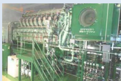
独自のエネルギープラントを備え、災害時でも安定的な電力供給が可能