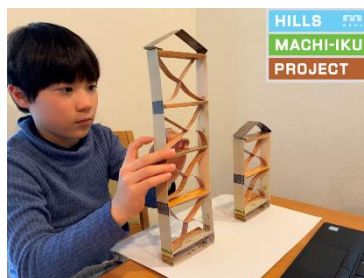
実験教材「紙ぶるる」を使い、「建物の安全・安心」を学ぶ