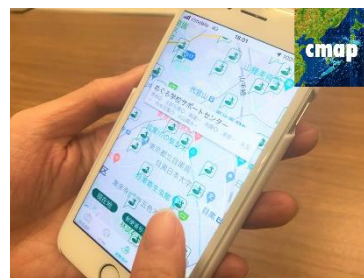
被害予測アプリ「cmap」を使い、有事の際の行動を学ぶ

ツアーでは、レクチャー形式で街(ヒルズ)を挙げた震災対策について解説しつつ、事前に自宅に送付される「実験教材」や「ヒミツの備蓄キット」などを実際に手にとって学んでいきます。また、震災対策クイズやチャットによる質問コーナーなど、オンラインならではの双方向コミュニケーションも積極的に取り入れ、安全・安心な「街」や「建物」、「日々の備え」について楽しく深く学んでいきます。さらに、今回は「cmap」のスマートフォン/タブレット用アプリにより、被害状況や避難場所を把握する体験を新たに追加することで、有事の際に役立つ、より実践的な行動について学びます。なお、あいおいニッセイ同和損保役員募金「MS&AD ゆにぞんスマイルクラブ」より、参加者に配布される教材や防災グッズを支援します。