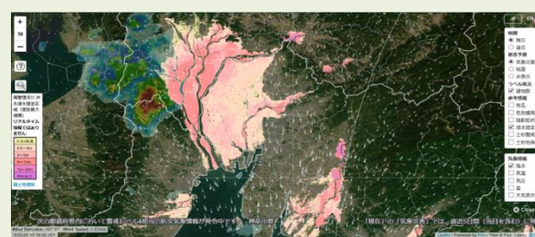
ハザードマップ（浸水想定）と降水地域を重ねたイメージ