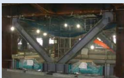
超高層タワーには高度な制振装置「オイルダンパー」を356台設置

特に、六本木ヒルズでは、建物自体を地震などの災害に強くするために、法定を上回る独自の耐震基準を採用するほか、3重のバックアップにより災害時にも安定した電気供給を可能とするエネルギープラントも設置。さらに、地区内には非常時の飲用水や、トイレ洗浄水および消防用水等を確保する災害用井戸や、非常用の水や食料を10万食分備蓄する備蓄倉庫などを備えています。また、港区と「災害発生時における帰宅困難者の受入れ等に関する協力協定」を締結し、約5000人の帰宅困難者を受け入れる体制を整備し、地域の防災拠点としての役割を担っています。