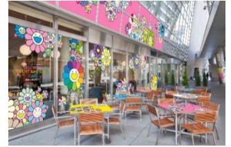
▼「お花の親子カフェ」メニュー(抜粋)

ヒルズ カフェ/スペースでは、3月5日(金)に、「お花の親子カフェ」が期間限定でオープン。現代アーティスト村上隆氏率いるアートカンパニー(カイカイキキ)の「Tonari no Zingaro」特設ショップも併設し、リアル店舗やWEB ショップで販売していた、村上氏の「お花」をモチーフにしたマスクやクッションなどの人気商品に加え、クッキーやステッカーなど新作の《お花の親子》関連アイテムが並びます。また、カフェスペースでは、「お花お子様ランチ」や「サーモン・いくらのお花の親子プレート」など「親子」にちなんだメニューも提供します。