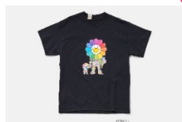
T シャツ 価格: 15,400 円 サイズ: 36/38/40(メンズ)

(ウエストウォーク 4F) ヴィンテージショップでキャリアをスタートした尾花大輔により、2001 年設立。過去にあったこと、もしくは、今ある古いものに新しい価値観を加え、全く新しいものを表現するブランド。六本木ヒルズ店限定のサービスと、他店舗とは一味違う商品を取り揃えています。