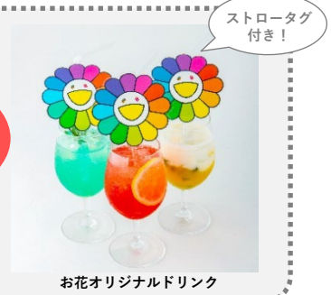
お花オリジナルドリンク