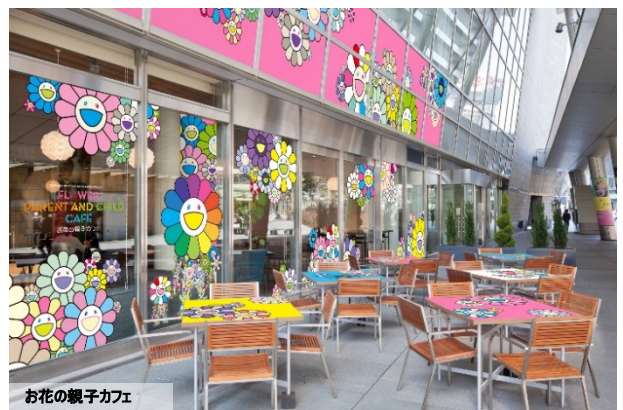
お花の親子カフェ

今回、オープンする「お花の親子カフェ」には、〈カイカイキキ〉の限定商品などを扱う「Tonari no Zingaro POP UP STORE」を併設。リアル店舗やWEBショップ以外で唯一、「Tonari no Zingaro」商品を手にとれるショップとなります。村上氏の「お花」をモチーフにしたマスクやクッションなどの人気商品に加え、クッキーやステッカーなど新作の《お花の親子》関連アイテムが集合。また、カフェスペースでは、「お花お子様ランチ」や「サーモン・いくらのお花の親子プレート」など「親子」にちなんだメニューも提供します。