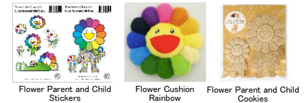
Flower Parent and Child Stickers