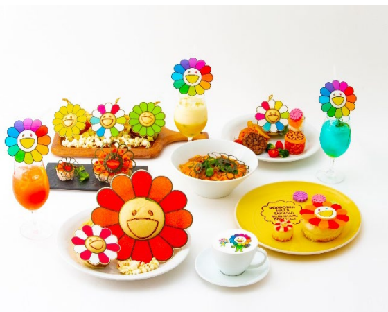
「お花の親子カフェ」メニュー

この春は、六本木ヒルズで村上氏の《お花の親子》の世界観を存分にお楽しみください。