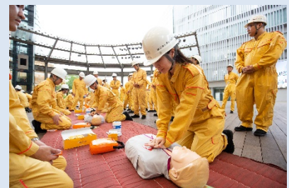
発災時の現場対応力向上の為継続的な防災人員育成に取り組む