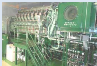
独自のエネルギープラントを備え、災害時でも安定的な電力供給が可能