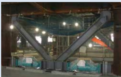
超高層タワーには高度な制振装置「オイルダンパー」を 356 台設置