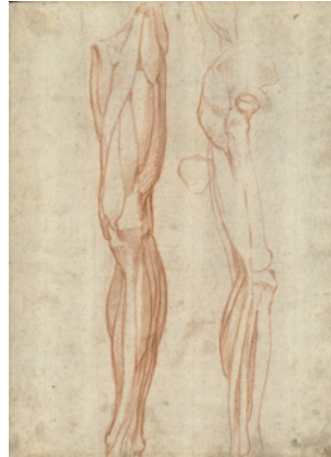
ミケランジェロ 《解剖図》 1515-1520年頃 ドロージング ウエルカム・ライブラリー