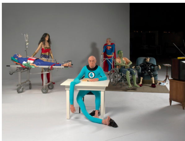
ジル・バルビエ《老人ホーム》2002年 ワックス・フィギュア、TV、マルチメディア サイズ可変 マーティンZ. マーキュリー氏蔵、マイアミ、アメリカ