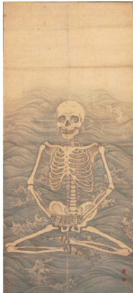
円山応挙 《波上白骨座禅図》掛幅 18世紀 132.6 x 59cm 大塚寺