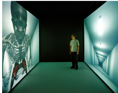
マグナス・ウォーリン 《エクササイズ・パレード》 2001年 ビデオインスタレーション(2面バック・プロジェクション、 3Dアニメーション・ビデオ) サイズ可変 2分48秒 作家蔵