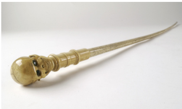
《杖 チャールズ・ダーウィン所有》 19世紀 ウエルカム・ライブラリー

掲載の画像を含む最新のプレス画像は、 森美術館ウェブサイトにて申請いただけます。