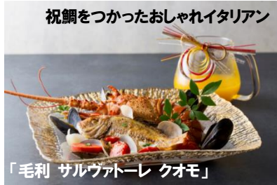
「毛利 サルヴァトーレ クオモ」