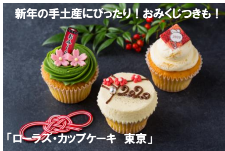
「ローラス・カップケーキ 東京」

NewYear2020 カップケーキ ¥648(イトイン¥660) 限定各 20 個/日