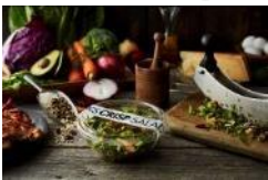
CRISP SALAD WORKS

カテゴリー: カスタムサラダ専門店 エリア: 虎ノ門ヒルズ 森タワー 2F 営業時間: 11:00~21:00