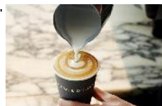
DEAN & DELUCA CAFE

カテゴリー: カフェ エリア: 虎ノ門ヒルズ 森タワー 2F 営業時間: 平日 7:30~19:00 土日祝 9:00~18:00