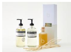
ESTNATION 「MARIE-STELLA-MARIS」HAND&BODY WASH、「bambord」WILLOW DIFFUSER