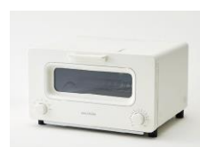
UNITED ARROWS ROPPONGI 「BALMUDA」THE TOASTER