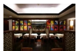
37 Steakhouse & Bar 5,000 円分ディナーチケット