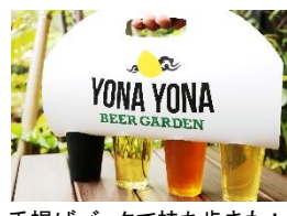
手揚げバックで持ち歩きも！