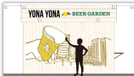
※ウォールアートイメージ