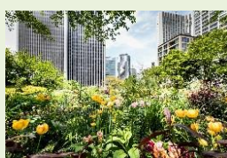
5月にはバラやアリウムなど