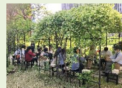
春の訪れを感じながらの優雅なランチタイムを。