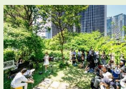
緑溢れる空間でのガーデンコンサートも開催!