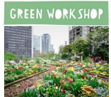
活動の拠点となるアークガーデン

申込方法： アークヒルズ公式 HP より https://www.arkhills.com/