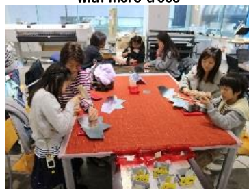
11月中旬~12月下旬 アークヒルズ クリスマス