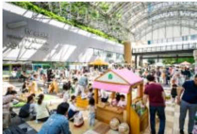
5月3日(金・祝)~5日(日・祝) 木とあそぼう 森をかんがえよう with more trees