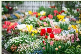
4月上旬にはカラフルなチューリップの花々が咲誇ります!