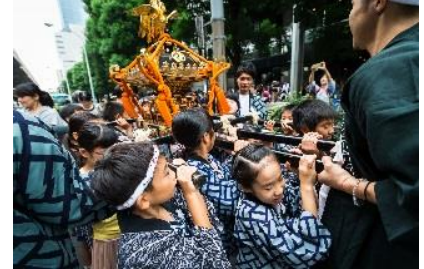
9月中旬 アークヒルズ 秋祭り