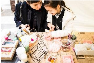
4月5日(金)~7日(日) アークヒルズ さくらまつり

アークヒルズでは、年間を通じて行う季節のイベントに、子どもたちが参加できる様々なワークショップやイベントを組み込み、アークヒルズ全体を通して、子どもたちに上質で“本物”の体験となる機会を提供しています。