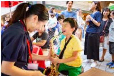
10月上旬 ARK Hills Music Week