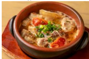
リゴレット バーアンドグリル 『スペイン風モツ煮込み』 ¥500