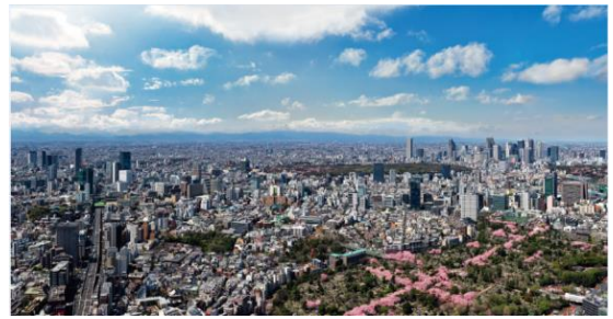
「東京シティビュー」から見える青山霊園の桜並木

六本木ヒルズ展望台 東京シティビューは、都内屈指の高さから東京タワーや東京スカイツリーなどの東京のランドマークなどの景色を鑑賞できるだけでなく、この時期は、都内各所の桜の名所を見下ろしながら鑑賞することができます。海拔 270m、都内では最も空に近い場所であるオープンエアの屋外展望台、屋上「スカイデッキ」からは、桜を上から見物する、東京シティビューならではの貴重な『天空のお花見』が体験できます。渋谷・新宿方面の眼下の広がる青山霊園の桜並木がピンクの十字として現れている様子は、この場所からしか見ることができない期間限定の貴重な景色です。