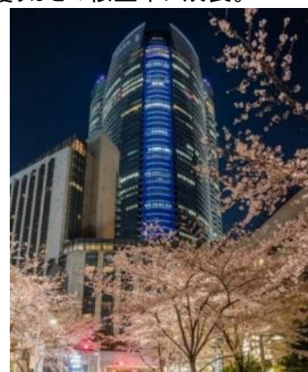
六本木ヒルズ森タワーと桜並木のコラボレーション