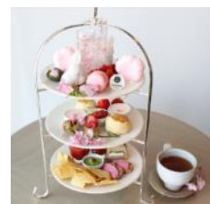
「さくら AfterMOON Tea」