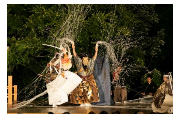
※薪能公演イメージ