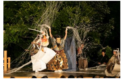
※写真はイメージであり、演目内容は異なります。

※主催:GINZA SIX リテールマネジメント株式会社/共催:一般社団法人観世会