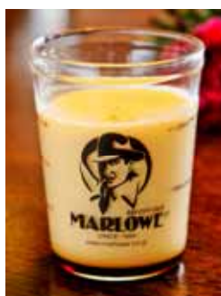
吟醸酒のプリン (マーロウ) 価格:750円