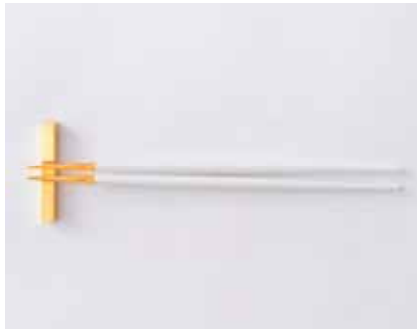
Cutipol GOAホワイトマットゴールド オハシセット (#0107 PLAZA) 価格:4,900円