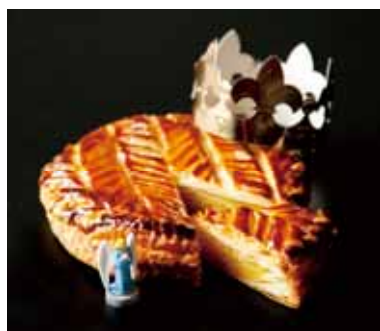
ガレットデロワ (Viennoiserie JEAN FRANCOIS) 価格:1ホール 1,300円