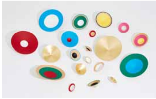
酔独楽 (D-BROS) 価格:35,000円 / 40,000円 (サイズ違いの盃4個セット、台座1個入り)