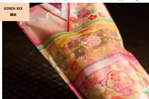
こはく単衣 (ぎんざ鏡花水月) 価格:550円