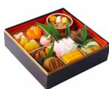
スイーツおせち (荻野屋) 価格:4,000円