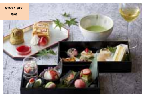
本格茶室でのお抹茶体験付き 和×莓新春プレミアムアフタヌーンティーセット (THE GRAND GINZA) 価格:6,500円