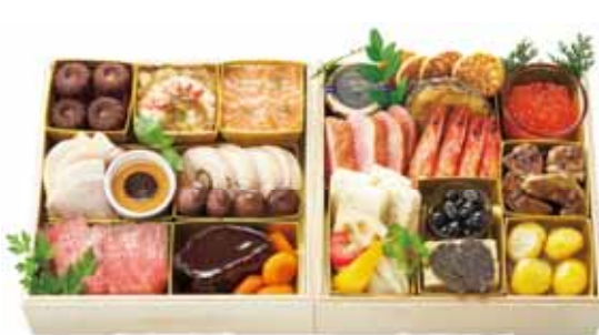
オザミ特製おせち料理 (ビストロオザミ) 価格:29,630円