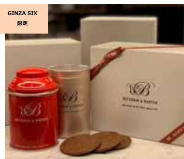
ニューイヤーズレクション (BETJEMAN & BARTON) 価格:4,200円