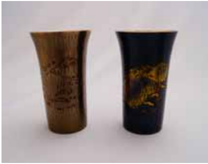
ビールカップ 亥 (玉川堂) 価格:各25,000円