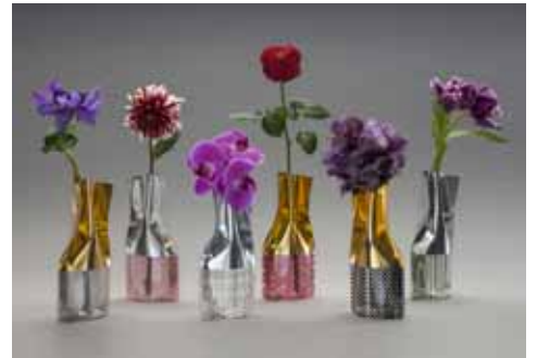
フラワーベース (D-BROS) 価格:1,800円(2柄入り)