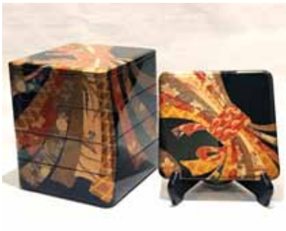
四段重 熨斗蒔絵 (漆器 山田平安堂) 価格:2,500,000円