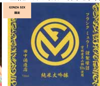
FRANCK MULLER 純米大吟醸 金箔入特製限定 祝酒 (FRANCK MULLER GENEVE) 価格:10,000円(720ml)