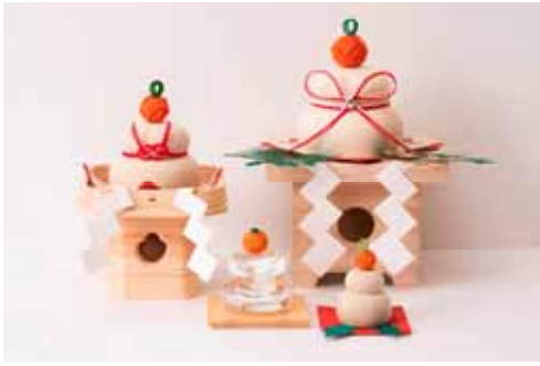
鏡餅飾り (中川政七商店) 価格:4,000円~20,000円