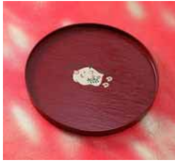
干支丸盆 (漆器 山田平安堂) 価格:4,000円