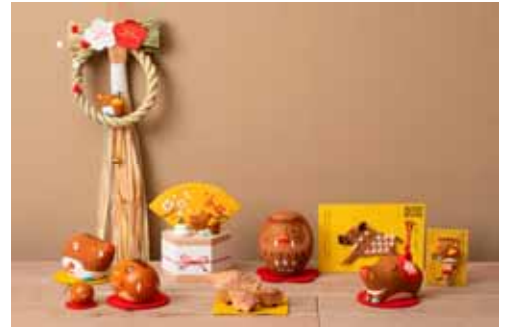
ふきん、お飾り、ポチ袋、食品 (中川政七商店) 価格:300円~50,000円