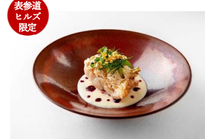
表参道 ヒルズ 限定