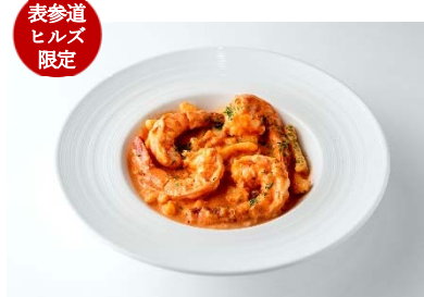
表参道 ヒルズ 限定