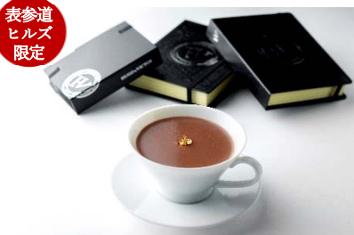
ユーゴ アンド ヴィクトール (本館 1F) Meilleurs Voeux (メイユール・ヴー) 1,080 円

カカオバリー社「メキシック カカオ66%」のチョコレートを贅沢に使用した濃厚なショコラショー。ライムの皮の代わりに金箔を浮かべた新年らしく豪華な一品です。