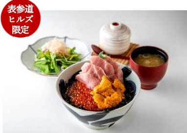
表参道 ヒルズ 限定