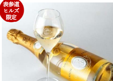
ワインショップ・エノテカ & バー (本館 3F)

2008年ルイ・ロデレール・クリスタル 50ml & ロゴ入りグラスプレゼント 2,700 円