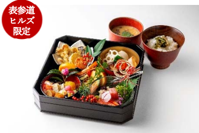
表参道 ヒルズ 限定

マグロ、ぼたんエビ、鯛など 7 種の魚介に、キャビアとビーポレン(蜜蜂花粉)、金箔を散らした豪華海鮮丼は見た目にも美しい一品。国産のはとむぎや黒大豆を合わせた「五穀茶」付きです。