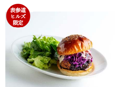
表参道 ヒルズ 限定