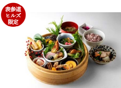
表参道 ヒルズ 限定

ひらたけ、タモギたけ、朱鷺色ひらたけ、柳松茸、ポルチーニ茸を加えたきのこづくしのリゾットに、白トリュフを目の前で削ってかける贅を尽くした一品。