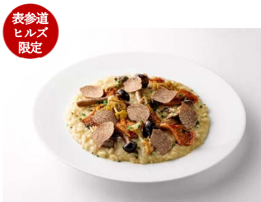
表参道 ヒルズ 限定