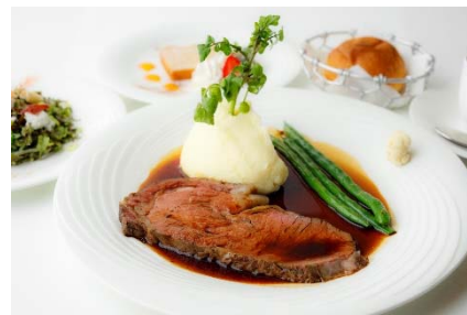
37 ローストビーフ メニューイメージ