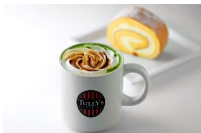
タリーズコーヒー (西館 B1F) 黒蜜きなこ抹茶ラテ (HOT/ICED) 550 円

黒蜜のコクのある甘さと、きなこの香ばしい香りが、宇治抹茶の上品な味わいを引き立てた抹茶ラテ。1月6日(日)までの限定メニューです。