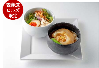
表参道 ヒルズ 限定