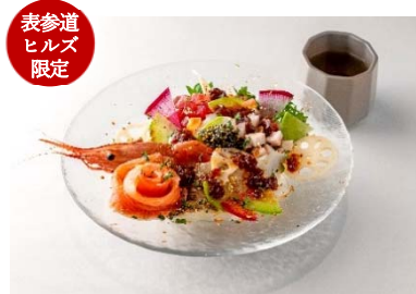
表参道 ヒルズ 限定 コスメキッチン アダプテーション (本館 B2F)