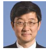
野城智也教授 (東京大学 生産技術研究所教授)