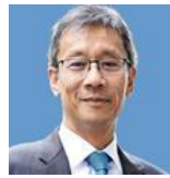
藤井輝夫教授 (東京大学 執行役・副学長)