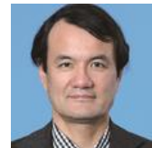
山中俊治教授 (東京大学 生産技術研究所教授)