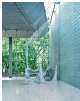
つぼみの円舞/ポーラ美術館