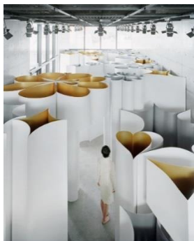
Heart of Shapes/DIESEL ART GALLERY

2008-2009年 DIESEL ART GALLERY にて空間インスタレーション「Heart of Shapes」を展示。2014年および2016年ヴェネツィア建築ビエンナーレ出展。現在、ビエンナーレ凱旋記念の空間作品「つぼみの円舞」がポーラ美術館(箱根)に特別展示中。2015年 SHISEIDO の Beauty vs World 新アイコン「Two Camellia for U」をデザイン。